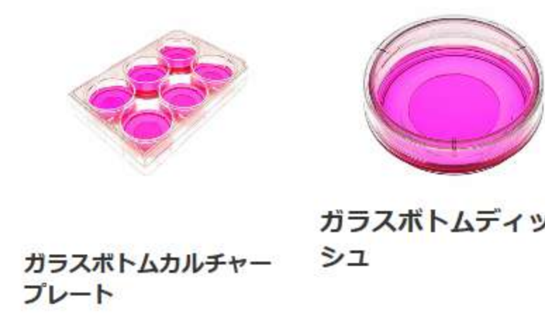
ガラスボトムカルチャープレート